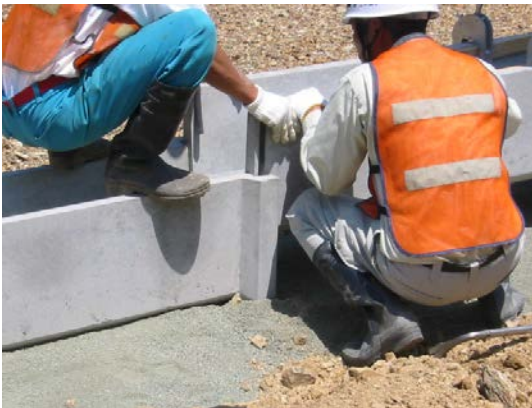
ソケット部噛み合わせ状況